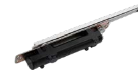
DORMA ITS96 - verdeckt