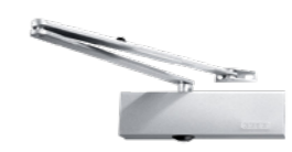
GEZE TS2000 - obenliegend mit Gestänge