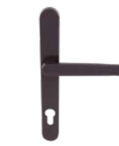
Türklinke für Rollladen