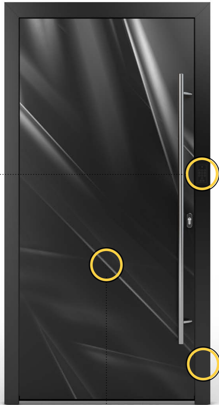
Modell 15 | Muster 1