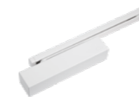
DORMA TS93 BASIC - obenliegend mit Gleitschiene